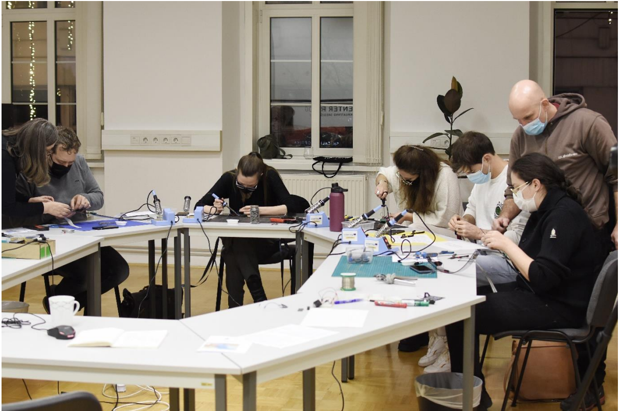
Foto: delavnica Poetični bradovci: Kako zvočijo gobe? , december 2021 (avtorica Nika Curk)